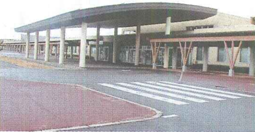
全国から見学者が訪れている支援エリア

秋田市郊外の一面に集められた大型建築物が建造された。同エリアは、12年度木材利用優良施設コンクールで、木材利用推進中央協議会が発行している12年版写真で見られる「木」の施設(冊子)で紹介されている。同エリアは、内装に木材を使用したことで、安らぎと温もりが感じられ、木の香が漂う。また、けがをしにくいということでも喜ばれている。デザインが優れていることから見学者も多い。