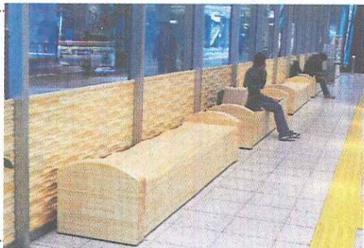
広島県産松を使ったベンチとパネル

広島空港の1階、バス券売機のあるバス乗り場側に、宏栄産市(広島県)と今治市(愛媛県)を結ぶ瀬戸内市、川上正昭社(しまなみ海道をモチーフ)が広島県産松にデザイン。座の部分は波を打ったような形「しまなみベンチ」と、ベンチだ。松3次元デザインパネル(集成材)は樹脂を注入することで寸法安定性を図るほか、加工性、断熱性など優れた特徴を持つ改質木材の「ハーモニウッド」が使われている。3次元パネルの壁面模様は6種類からなり、流れるような壁面に新しい表情を演出。今回は裏表両面に2種類のパネルを採用している。